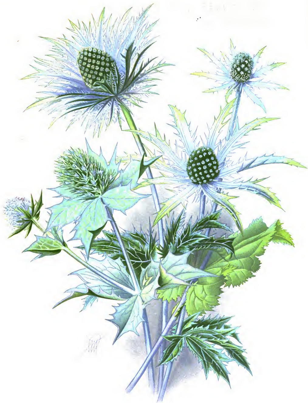
Eryngium alpinum , E. Zabeli и E. maritimum . Синеголовъ [Ернiгiй] альпiйскiй, Сн. Цабеля и Сн. приморскiй.